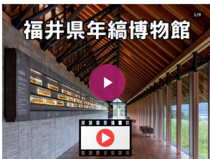
【たひこト講座動画配信】年縞博物館