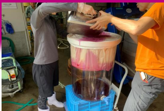
ワインの醸造実習