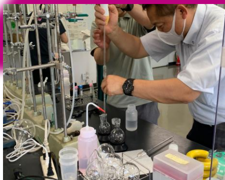
ワインの成分分析