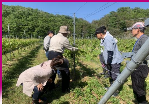
ブドウの栽培実習