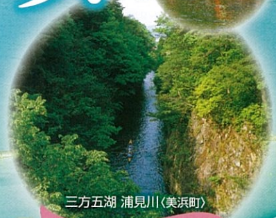
三方五湖 浦見川(美浜町)