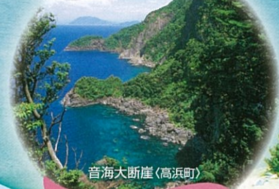
音海大断崖(高浜町)