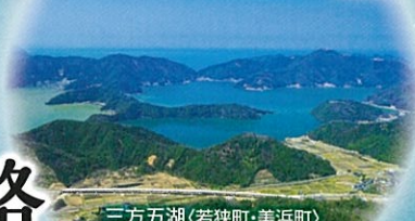
三方五湖(若狭町・美浜町)