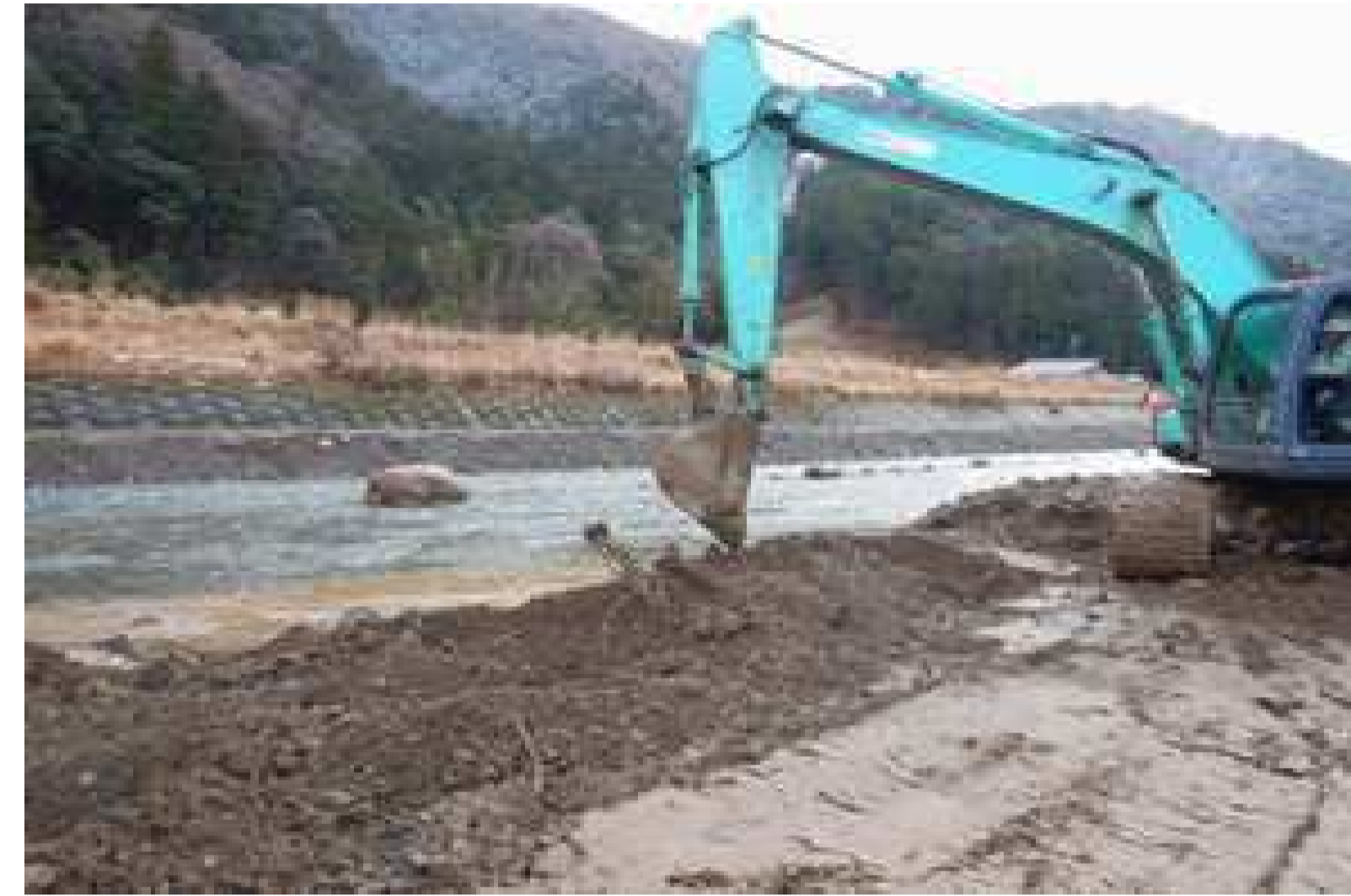
施工状況 (河道修正)