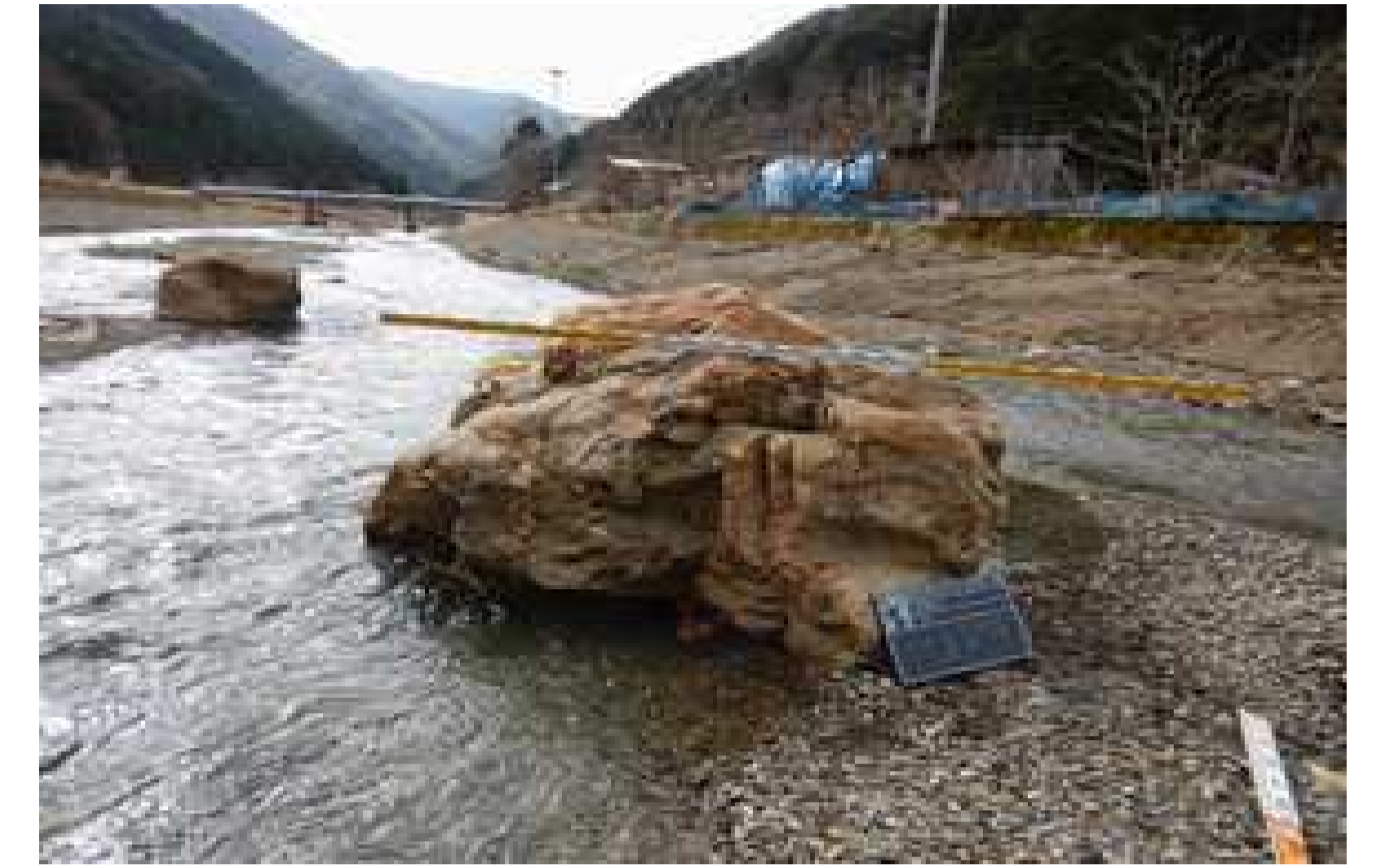
施工状況 (巨石配置)