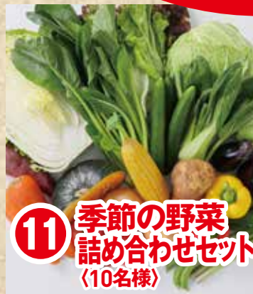
11 季節の野菜 詰め合わせセット (10名様)