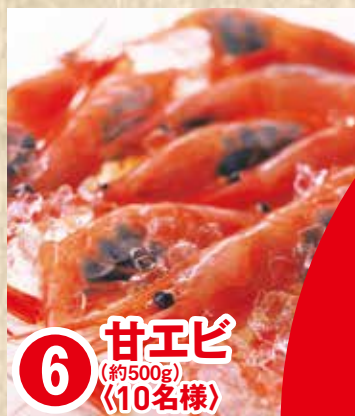
6 甘エビ (約500g) 〈10名様〉