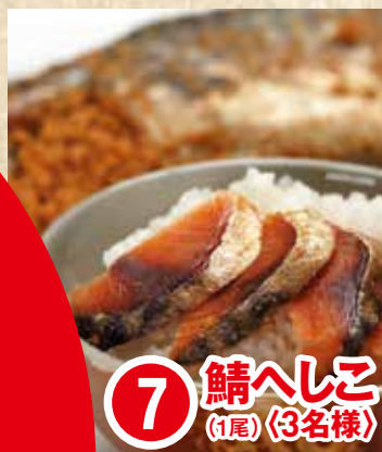
7 鯖へしこ (1尾) 〈3名様〉