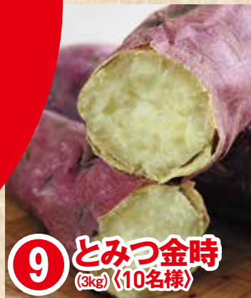
9 とみつ金時 (3kg) 〈10名様〉

福井県産の 農林水産物についているマークを 3つ集めて応募しよう! 抽選で計100名様に 福井県の特産品を プレゼント!