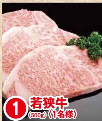
1 若狭牛 (500g) 〈1名様〉