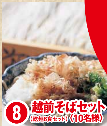
8 越前そばセット (乾麺6食セット) 〈10名様〉