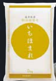
いちほまれ ③ 5kg 〈3名様〉 ④ 2kg 〈5名様〉 ⑤ 300g(2合) 〈35名様〉