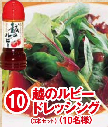
10 越のルビー ドレッシング (3本セット) 〈10名様〉

福井県産の 農林水産物についているマークを 3つ集めて応募しよう! 抽選で計100名様に 福井県の特産品を プレゼント!