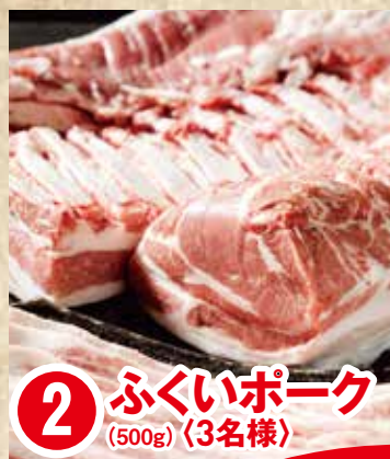
2 ふくいポーク (500g) 〈3名様〉