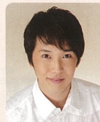
俳優 金子 貴俊氏