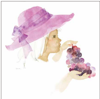
ぶどうを持つ少女(いわさきちひろ・絵 1973年) ちひろ美術館蔵