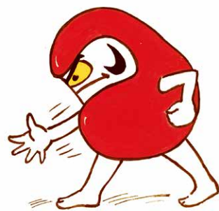
『だるまちゃん と てんぐちゃん』 (かこさとし・作/絵 福音館書店 1967年)より © Kako Research Institute Ltd. 1967