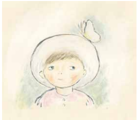
『わたしのぼうし』(佐野洋子・作/絵 ポプラ社 1976年)より オフィス・ジロチョー蔵 ©JIROCHO, Inc.