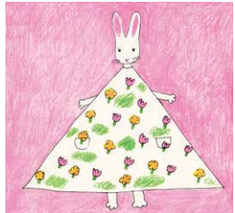
『わたしのワンピース』(西巻茅子・作/絵 こくま社 1969年/2002年)より ちひろ美術館蔵