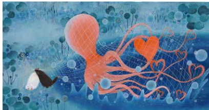
『きみへのおくりもの』(刀根里衣・作/絵 NHK出版 2015年)より 作家蔵