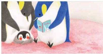
『ぼくのぼよんに』(刀根里衣・作/絵 NHK出版 2018年)より 作家蔵