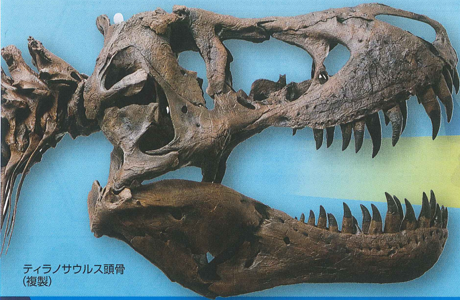
ティラノサウルス頭骨 (複製)