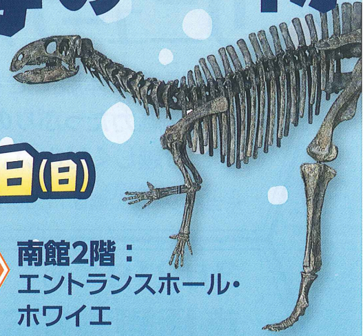
フクイサウルス全身骨格 (複製、全長4.6m)