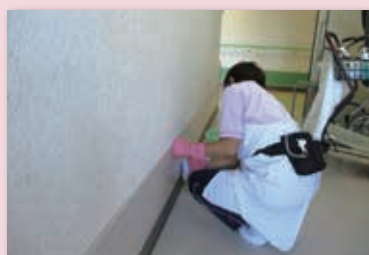
ちょこっと就労の様子

社会福祉法人福井県社会福祉協議会 福井県福祉人材センター（人材研修課） 〒910-8516 福井市光陽2丁目3-22 ☎ 0776-21-2294 FAX 0776-24-4187 E-mail jinzai-center@f-shakyo.or.jp