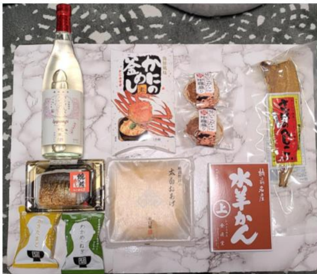
今回購入した商品。甘味から海の幸までどっさり。

紙袋いっぱい商品を集めて、埼玉に帰還。早速、調理して食べたいところだが、その前にこちらを紹介したい。