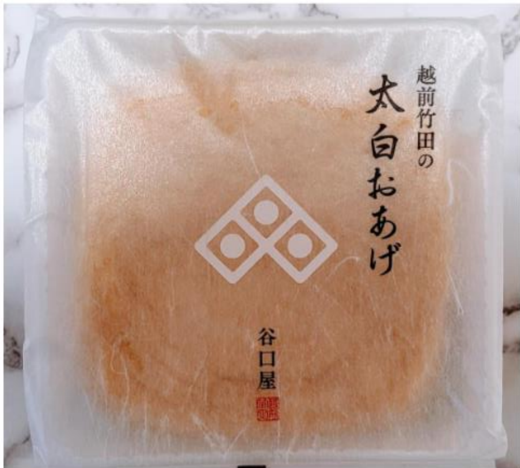
谷口屋の「太白おあげ」(パッケージ)