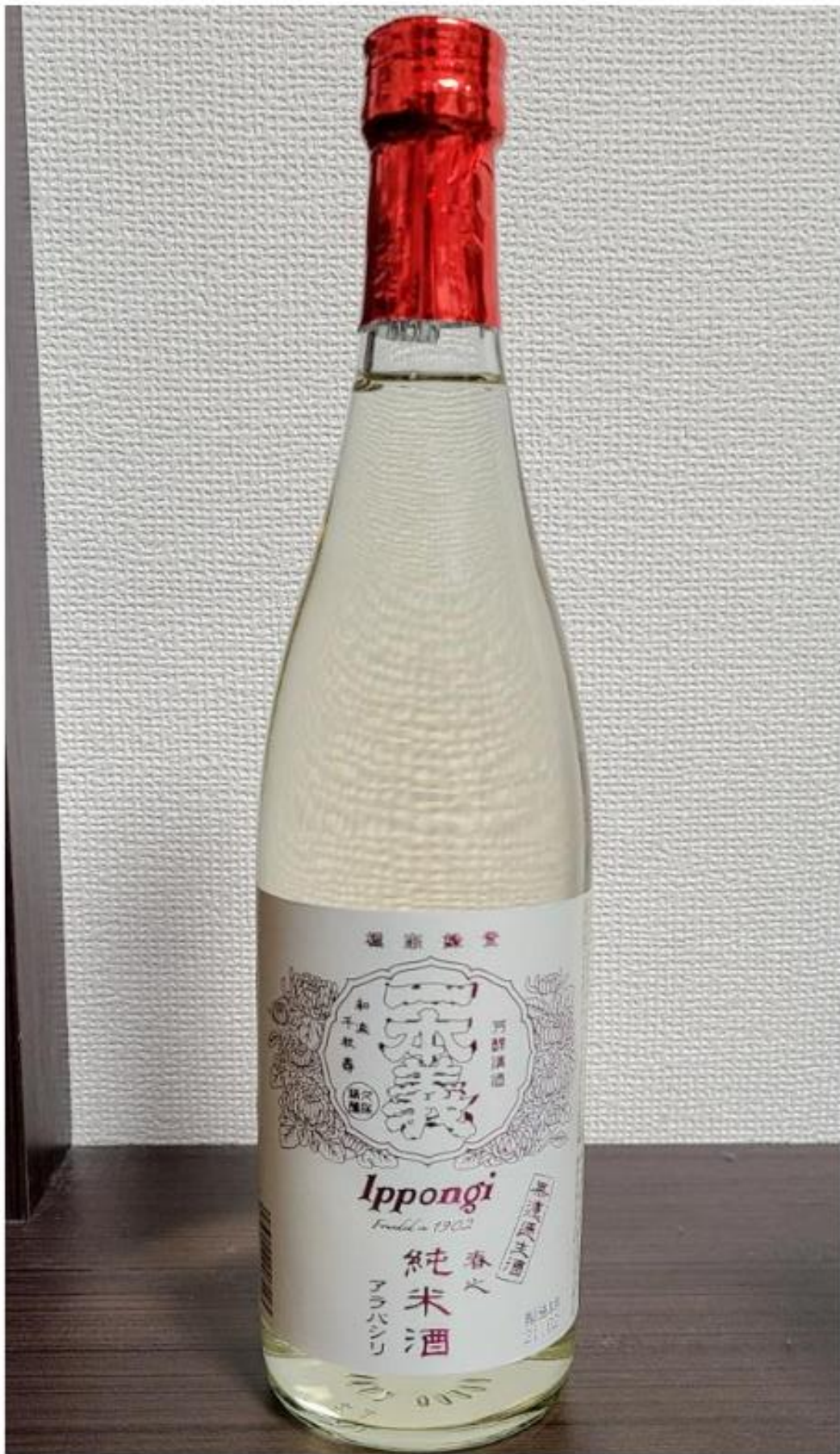
一本義純米アラバシリ

今回店長におすすめされたのは、福井の地酒「一本義」（勝山市、一本義久保本店）の中でも、春の季節酒である「アラバシリ」。酒を絞る際に最初に出てきたものをアラバシリと言うそうで、かつては酒造り人しか味わえなかったそう。