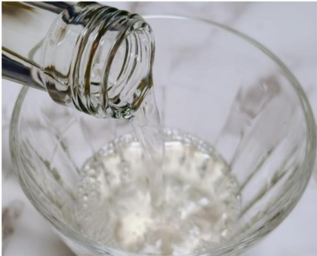
キレの良い香りが注ぐときから溢れる

味が安定しているという、中間に出る部分「中取り」と違い、荒々しい味わいが特徴だとか。