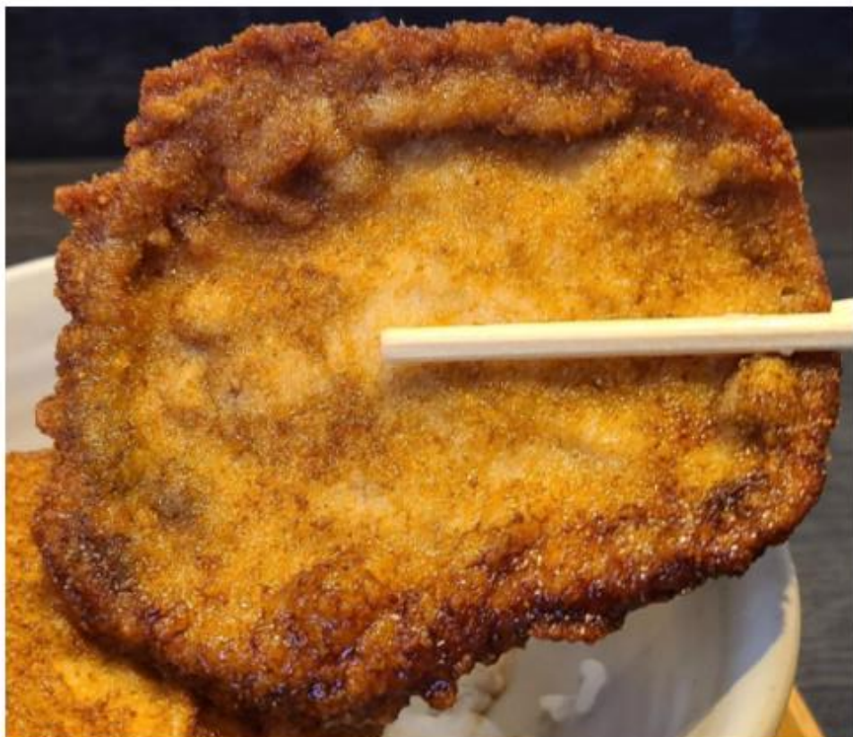
ローズカツに比べると少し小さいようだ

ソースカツ丼といえば、福井だけでなく、福島・会津若松などの名物でもある。特に福井にこだわる必要のないメニューにも思えるが、出てきた品を見て驚くばかり。ほかの地域では見かけない、キメの細かい衣に包まれた薄いカツに目を奪われる。