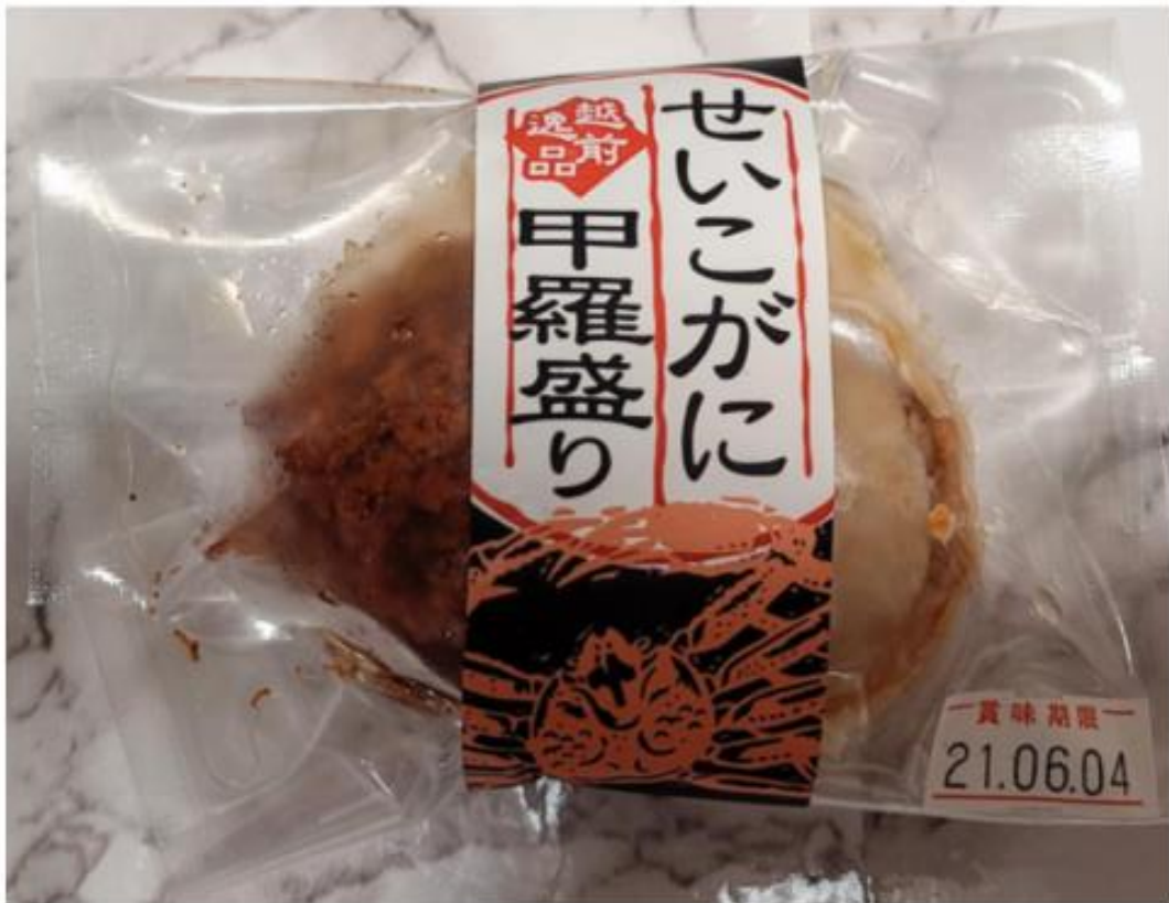
「せいこがにの甲羅盛り」のパッケージ

アンテナショップに行く前はカニを買って鍋にでもしようと思ったが、店長が意外な商品を勧めてきた。それが「せいこがにの甲羅盛り」だ。