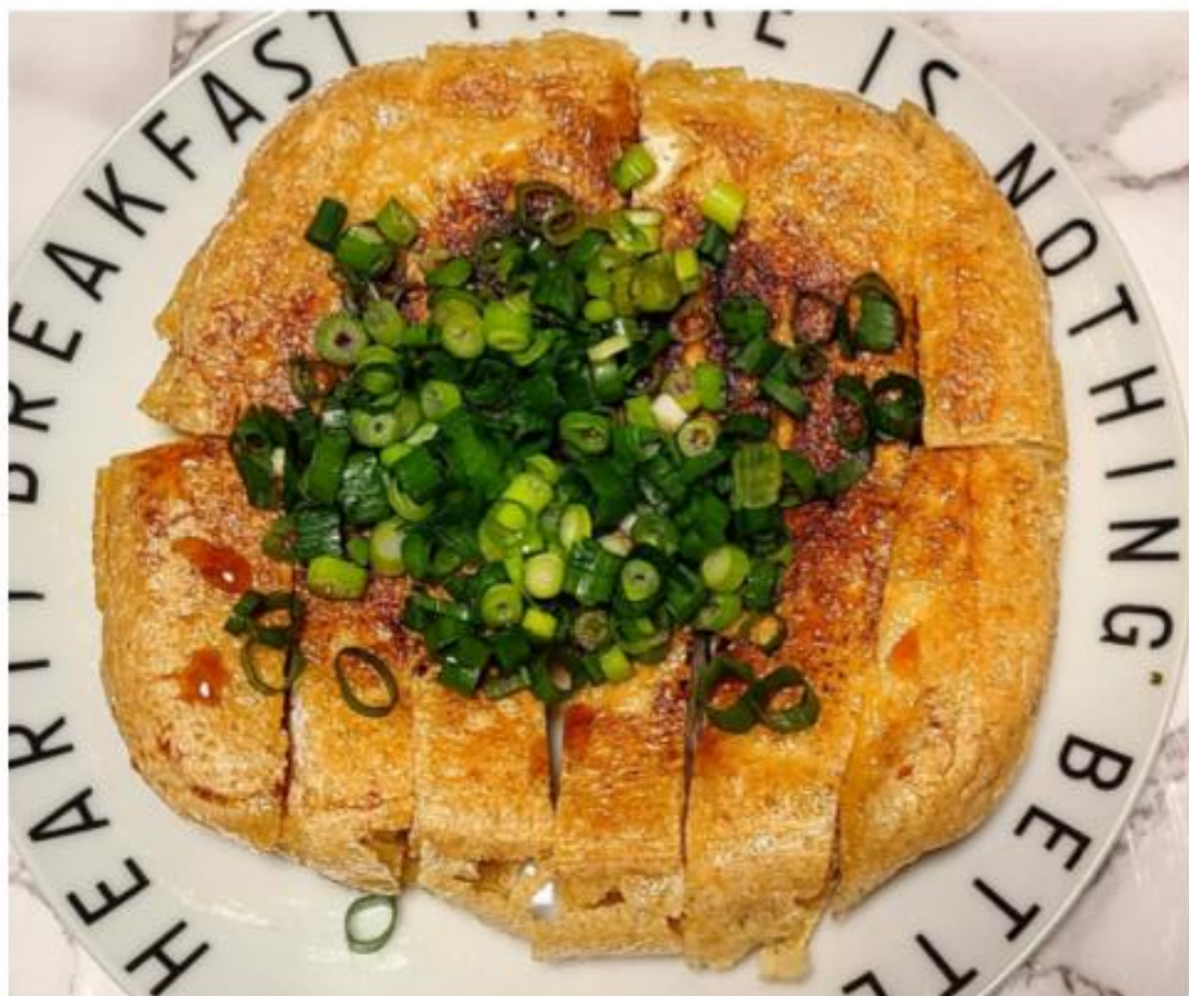
谷口屋の「太白おあげ」をフライパンで焼いて、刻みねぎをたっぷり。

今回は、これをフライパンで焼いて、たっぷり刻みねぎと適量の醤油を掛けて、シンプルにいただいた。