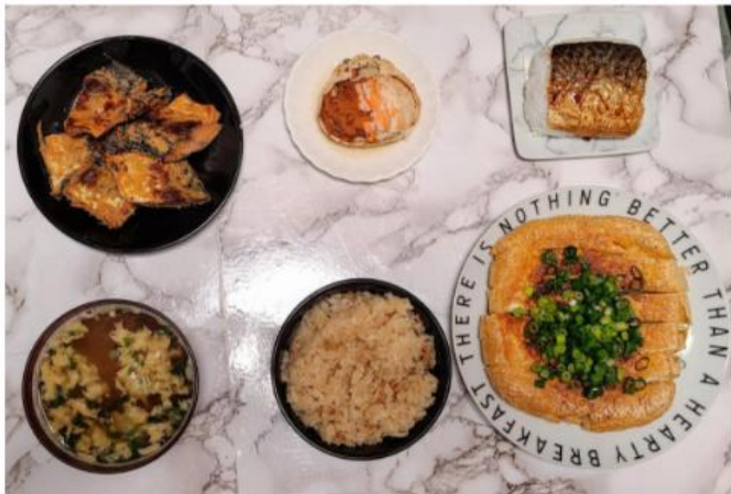
福井グルメだけで固めた夕飯

おやつを食べてのんびりしていたらすっかり日も暮れて夕食の時間に。アンテナショップで調達したグルメで、埼玉にいなながら福井を味わっていこう。