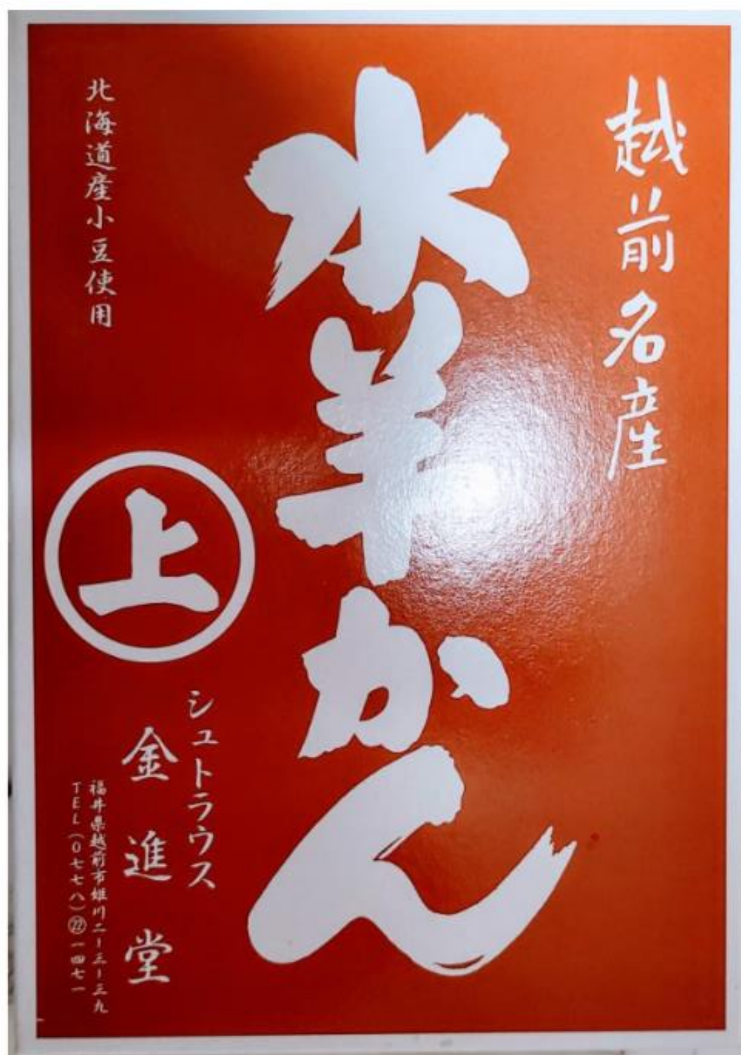
シユトラウス金進堂の「水ようかん」