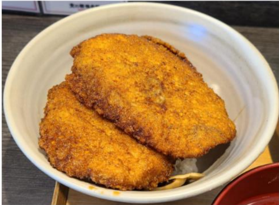
ソースカツ丼（ミニ）

ソースカツ丼といえば、福井だけでなく、福島・会津若松などの名物でもある。特に福井にこだわる必要のないメニューにも思えるが、出てきた品を見て驚くばかり。ほかの地域では見かけない、キメの細かい衣に包まれた薄いカツに目を奪われる。