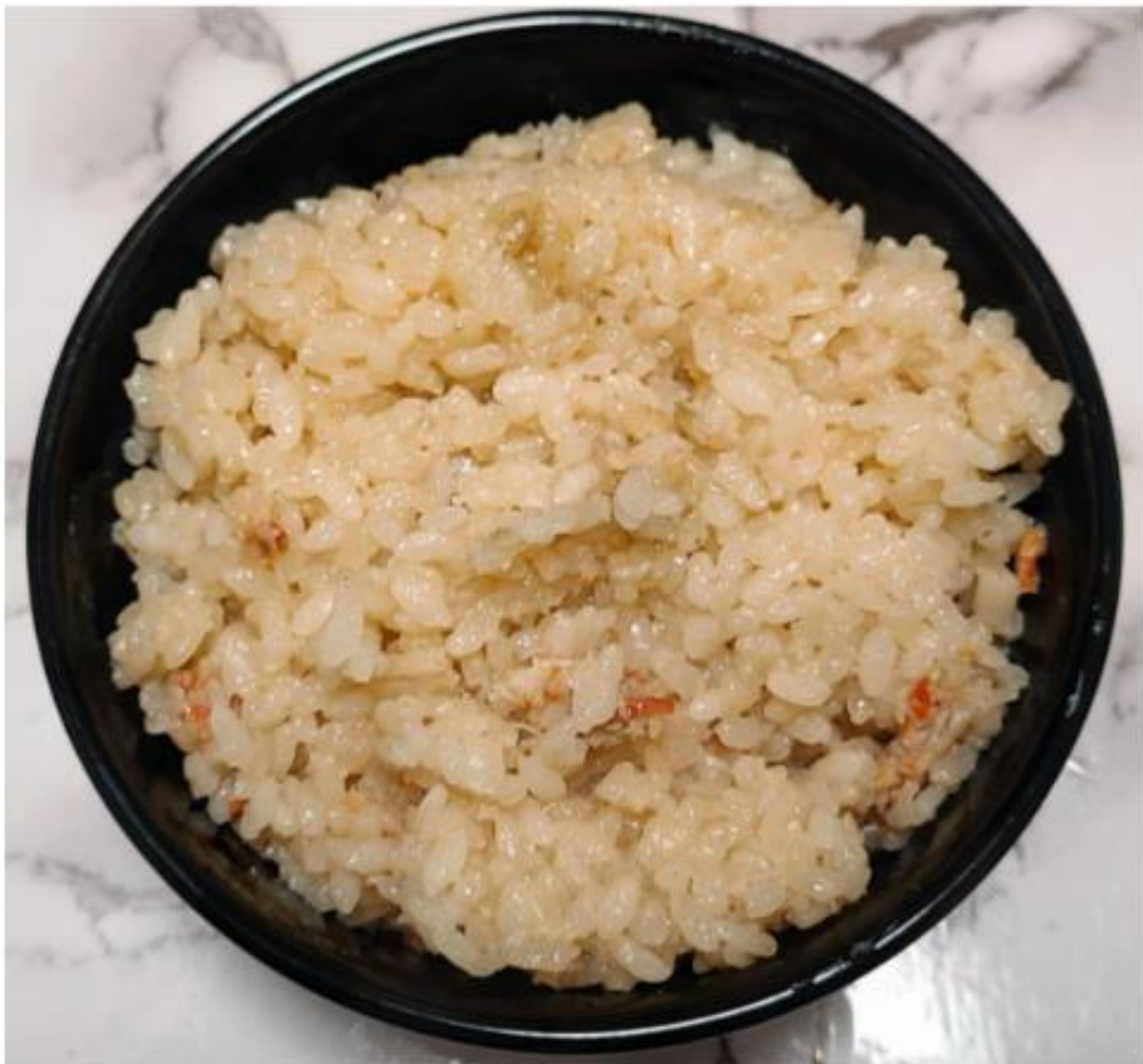
出来上がった「かに釜めし」

付属のかにみそも投入して炊き上げると、自宅で炊いたご飯とは思えないほどの芳醇なカニの香りが食欲をそそる。溢れる旨味はこれだけでも十分に満足だが、外子や内子といった「甲羅盛り」の中身と一緒に食べれば有頂天になってしまうこと請け合いだ。