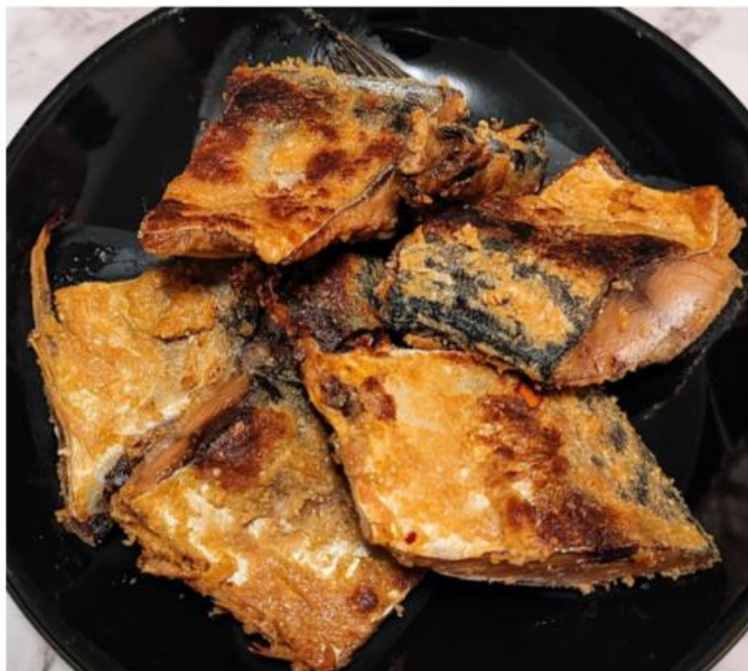
今回は焼きへしことしていただく

へしこは、少しずつ切り取って、糠を多めに残して火で炙るのがポイント。ただ、今回はへしこが半身もあるので家族から「俺にも食べせろ」との圧力を掛けられたため、仕方なく半身をほど良くカットして、すべて焼いた。