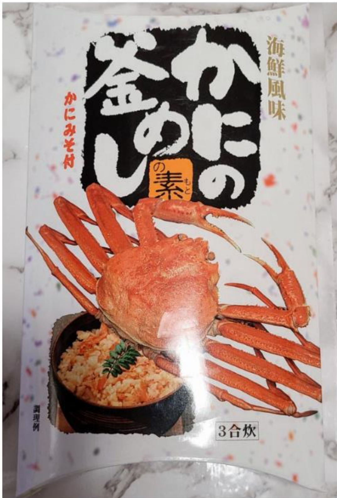
「かに釜めしのもと」

こちらもアンテナショップで手に入る品で、ベニズワイガニを100%使用し、出汁にもかにの殻が使われている。ご飯に加えて炊くだけでできる簡単さも魅力だ。