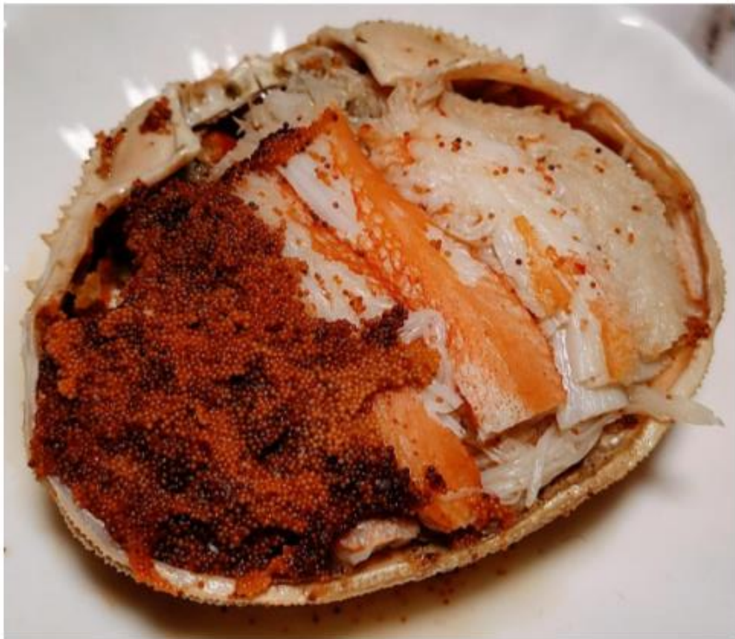
せいこがにの甲羅盛り