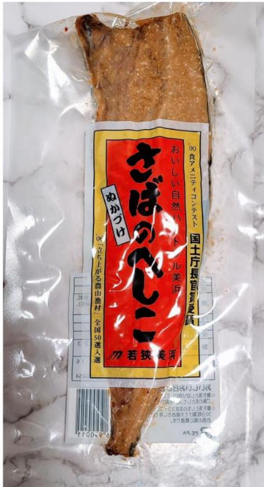
「美浜町なぎさ会・鯖のへしこ」

へしことは、日本海沿岸の漁師町を中心に古くから作られてきた福井の郷土料理で、サバなどの魚をぬかと塩で漬け込んだものだ。