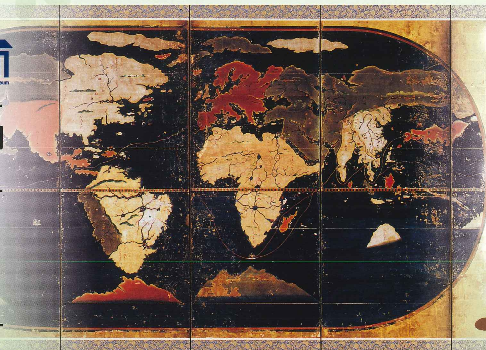
▲「世界及日本図〈八曲屏風〉」世界図(重要文化財 当館蔵)