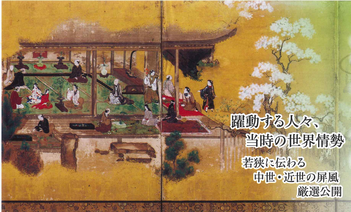
▲「武家邸内図屏風」(萬徳寺所蔵)