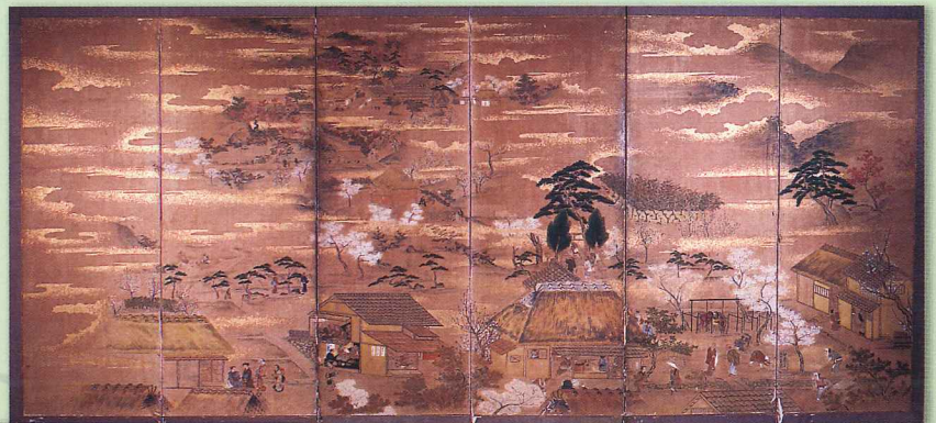
◀▲「神明神社頭風俗図」〈六曲一双〉 (小浜市指定文化財 空印寺所蔵)

また、重要文化財の「世界及日本図〈八曲屏風〉」(16世紀末)の原本が公開されます。屏風よりうかがえる前近代の人々の空間認識をぜひご覧ください。