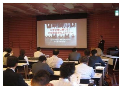
【採用力向上セミナー】