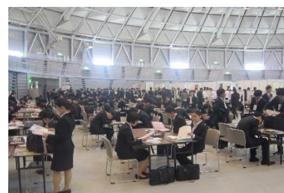
【ふるさと企業魅力発見フェア】