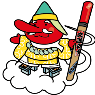
キャンペーンキャラクター