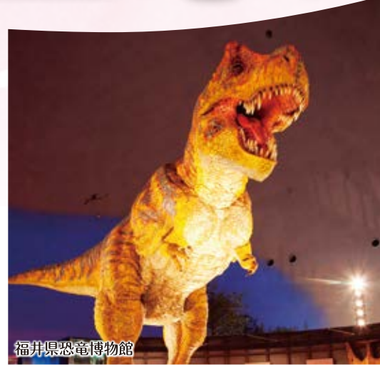
福井県恐竜博物館