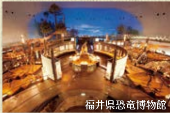
福井県恐竜博物館