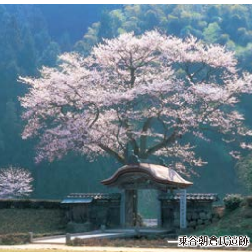
一乗谷朝倉氏遺跡