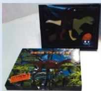
恐竜物語 フクイラプトル