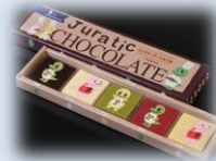
ジュラチックショコラ 10枚入り