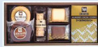
トッパス アソートギフト