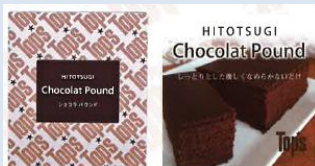
ショコラパウンドケーキ