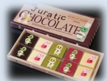
ジュラチックショコラ 20枚入り