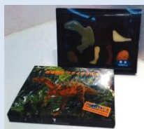
恐竜物語 フクイサウルス