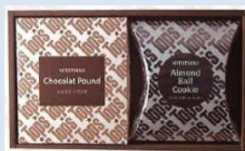
ショコラパウンドケーキ アーモンドボールセット