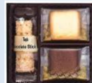
トッパス アソートギフト