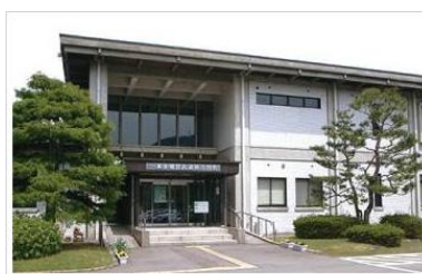
県立一乗谷朝倉氏遺跡資料館

県立一乗谷朝倉氏遺跡資料館 一乗谷朝倉氏遺跡復原町並 入場無料 平成26年5月3日(土)～5日(月) 通常230円のところ 無料