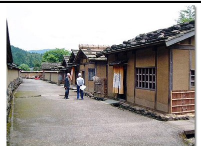
一乗谷朝倉氏遺跡復原町並