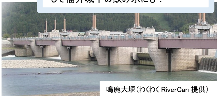
鳴鹿大堰

1000年前から、水をせき止め、水量をコントロール！九頭竜川は芝原上水として福井城下の飲み水にも！