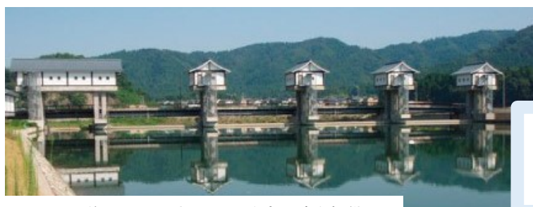
足羽川頭首工