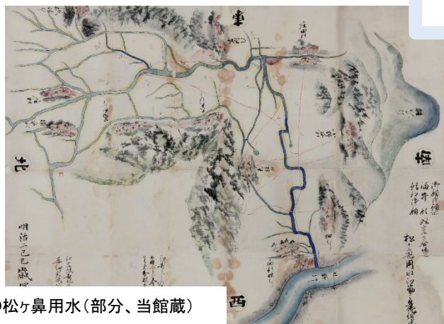
明治時代の松ヶ鼻用水(部分、当館蔵)