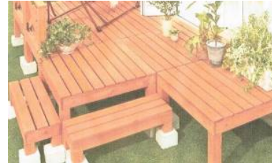
ウッドデッキ (イメージ)

これまで共同で開発してきた木材保存用薬剤が認証を受け、住宅資材に参入できるようになり、(株)マーベルコーポレーションは、品質、コストで優位性のある木材を国内で探していた。その際に木材生産量が多く、品質が高く、コストが抑えられる森林組合として紹介されたのが、利根沼田森林組合である。また、その木材を製材していたのが、(株)ウッドビレジ川場であり3社で連携して事業を開始していくことになった。