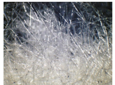
【和紙に含まれるポリエステル樹脂繊維】

販売の最低ロットを1,000㎡(色別)にて対応している(通常は1万㎡以上)。当社では一貫生産を行っており、多品種少量生産が可能、かつ商社などの中間流通業者を出来るだけ排除することで、適時適量で供給できる仕組みをつくりあげた。