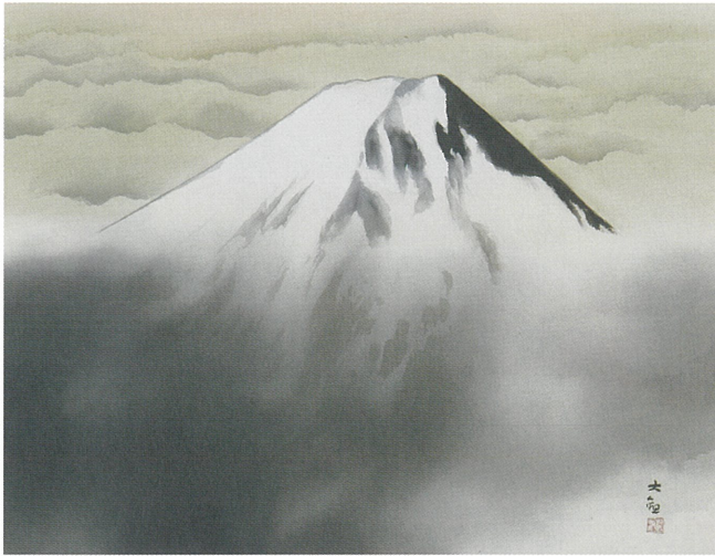
横山大観 「聳雲表」 1955年頃

敦賀市の地元企業である株式会社ジャクエツが 同市に寄贈した洋画・日本画の名品約20点を 特別公開します。