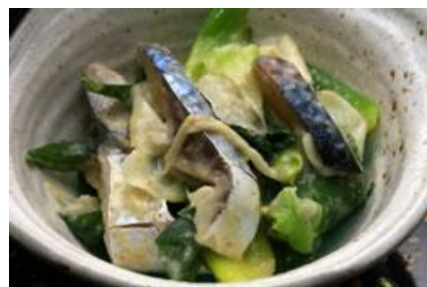
「谷田部ねぎの鯖のめた」

小浜の名物の鯖とも相性が良く、しめ鯖と谷田部ねぎを酢味噌で和えた「めた」は、代表的な郷土料理の一つである。他にも、すき焼き、鍋物だけでなく魚と煮付けてもおいしい。