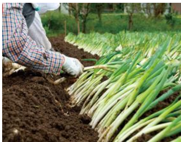
8~9月に斜めに植え替える栽培方法