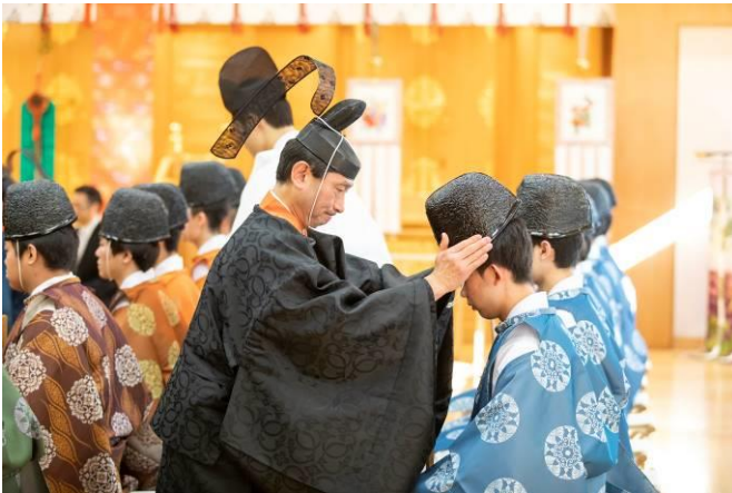
國學院大學での加冠儀式の様子（参考）