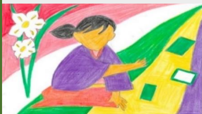
作品A 「かるた王国 福井」