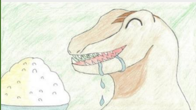
作品D 「恐竜におもてなし」