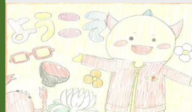
作品H 「ようこそ福井へ！」