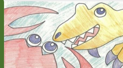
作品F 「福井といえばカニと恐竜！」