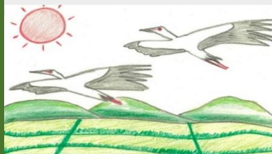
作品B 「コウノトリと里山の風景」