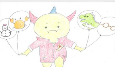
作品G 「魅力であふれる福井」