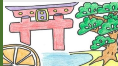
作品C 「私の大好きな敦賀」