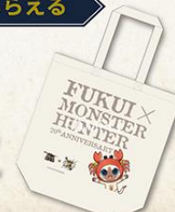
オリジナルトートバッグ