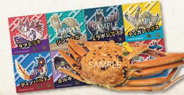
越前がに極&ステッカー8種 コンプリートセット