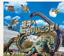
アクリルジオラマ