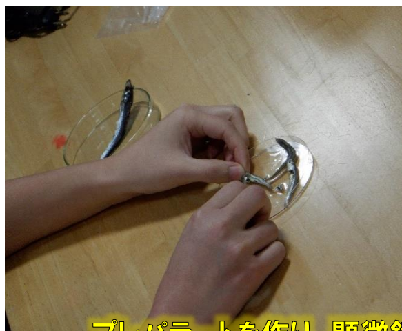
プレパラートを作り、顕微鏡で観察します。