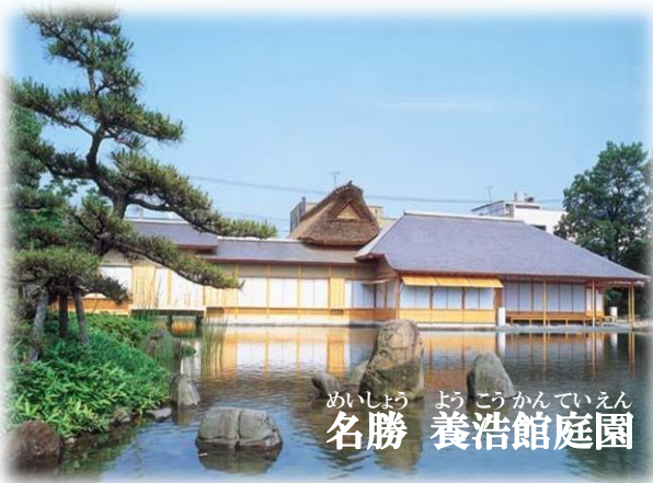
めいしやう ようこうかんでいえん 名勝 養浩館庭園

“名勝 養浩館庭園”は、日本の伝統的な素晴らしい庭園です。浴衣を着て、養浩館庭園を歩いたあと、“福井フェニックスまつり”(福井県で一番大きい夏のまつり)へ出かけて、日本の夏を楽しみませんか!