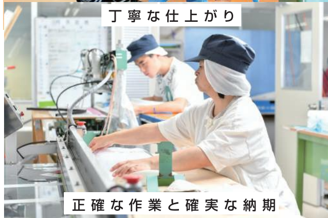
正確な作業と確実な納期