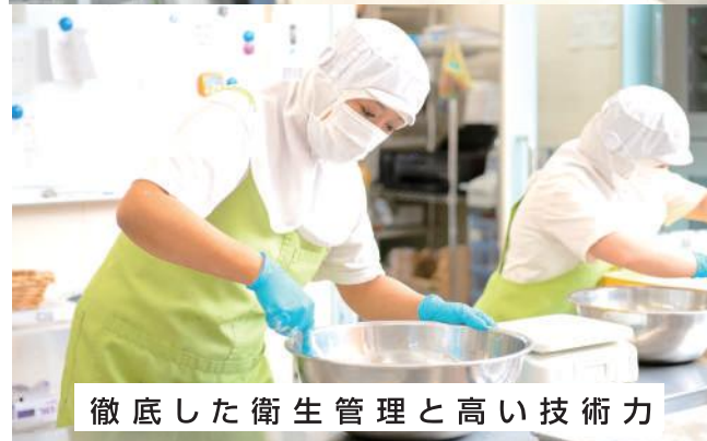
徹底した衛生管理と高い技術力