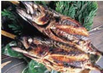
鱈を一匹まるごと焼く 浜焼き鱈