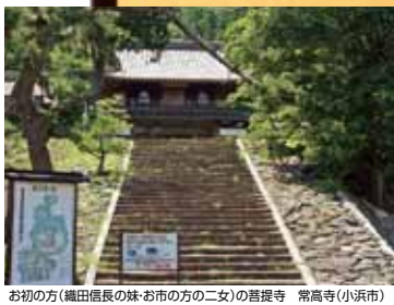
お初の方(細田信長の妹・お市の方の二女)の菩提寺 常高寺(小浜市)