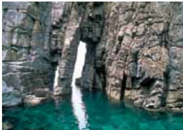
豪壮雄大な姿 蘇洞門(小浜市)