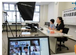
昨年度講座の様子

ふわふわパンを作って、発酵を促す微生物、カビや酵母について学び、食の安全安心について考えよう!