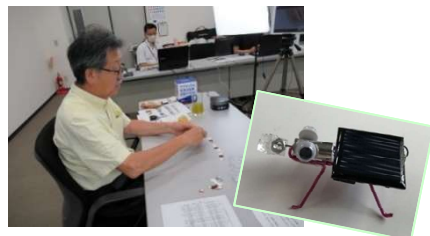
昨年度講座の様子

おうちで工作に挑戦!ソーラーで動くオリジナルの虫を作り、発電する仕組みや地球の環境問題について学習しよう!