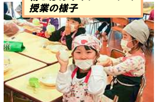
朝ごはんキャンペーンの 授業の様子

米の消費量減少や朝食を欠食する若者が多いことから、和食の無形文化遺産登録をきっかけに、風土に合った「ごはん食」を子どもたちの成長過程で育み、「ごはん食」の普及、ライフスタイルとしての定着を目的に、農業の持つ教育力を通して「いのち」と「食と農」の大切さを伝える食農教育を始めたことです。