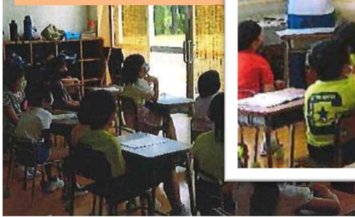
授業を受ける 子どもたちの様子