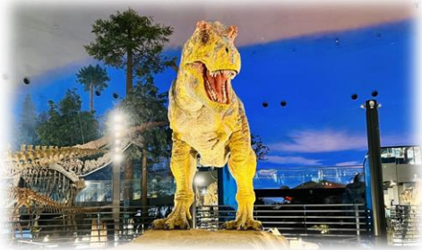
福井県立恐竜博物館