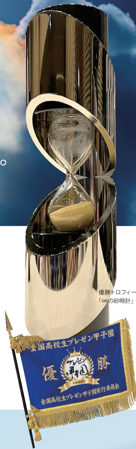
優勝トロフィー 「∞の砂時計」