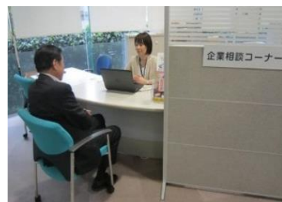
【企業相談コーナー】