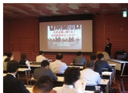
【採用力向上セミナー】