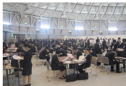
【ふるさと企業魅力発見フェア】