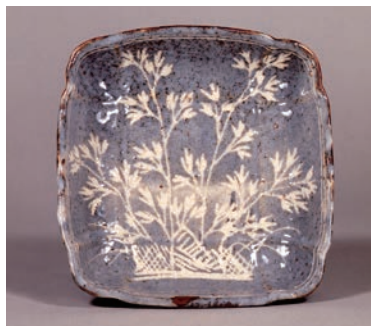
鼠志野草文向付 桃山時代 (熊本県立美術館蔵)