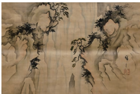
日光滝図 二代歌川廣重 (熊本県立美術館蔵)