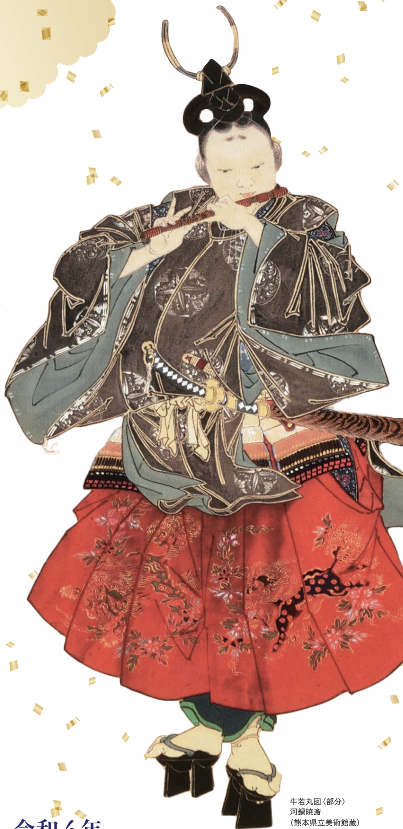
牛若丸図(部分) 河鍋曉斎 (熊本県立美術館蔵)