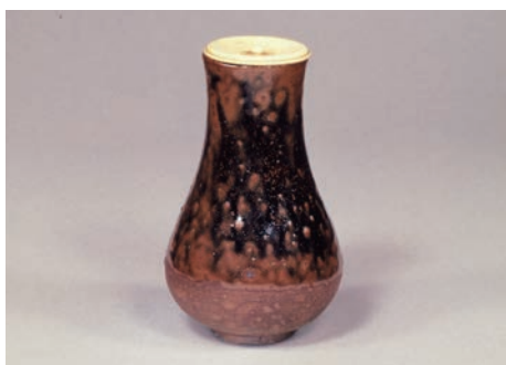
丹波鶴首茶入 桃山時代 (熊本県立美術館蔵)