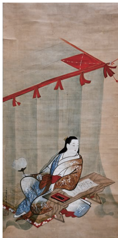
蚊帳脇美人図 竹田春信 (熊本県立美術館蔵)