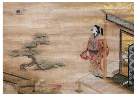
美人観月図 無款 (熊本県立美術館蔵)