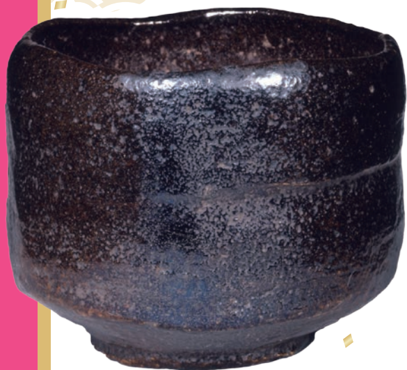
黒楽茶碗 銘「灘波江」江戸時代 (熊本県立美術館蔵)