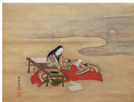
紫式部図 小川破笠 (熊本県立美術館蔵)