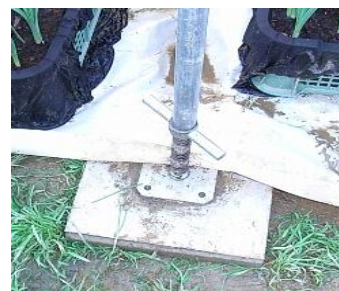
ジャッキ付きの台