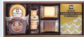
トッパス アソートギフト