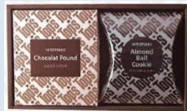
ショコラパウンドケーキ アーモンドボールセット