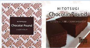
ショコラパウンドケーキ