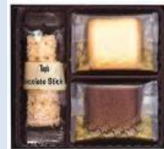
トッパス アソートギフト