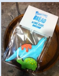
アイシングクッキー (2枚セット)