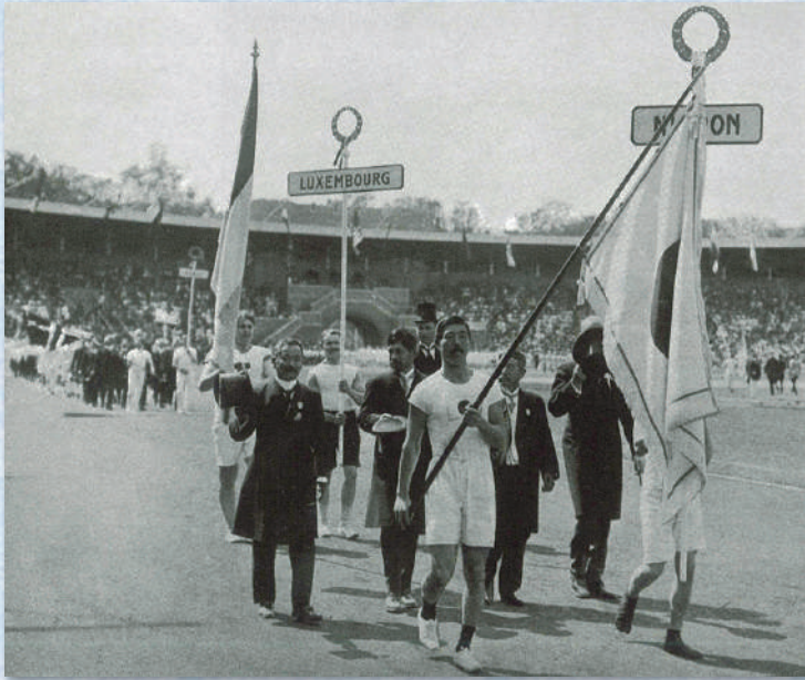
ストックホルム大会開会式(1912年) (日本が初参加したオリンピック)

この夏、第33回パリオリンピックが開催されます。4年に一度開催されるオリンピックは、いつの時代にも注目を集め、長く人々の記憶に刻まれてきました。教科書にも感動を伝える題材が取り上げられています。