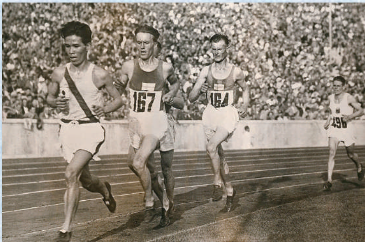
村社講平選手(1936年) (ベルリン大会5000m、10000m 4位)

今回の展示では令和3年に開催した特別展「オリンピック・パラリンピックと教科書」を再構成し、オリンピックやパラリンピック選手、大会でのエピソードを教科書とともに、ミニ展示としてご紹介します。