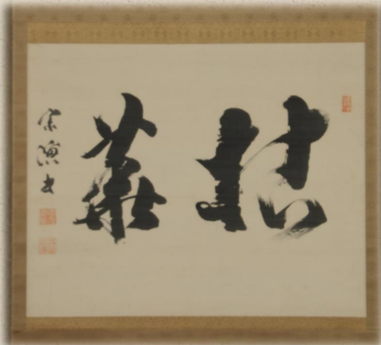
釈宗演「拈華」〔若州一滴文庫所蔵〕