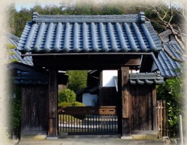
(若州一滴文庫:若狭の禅僧の書を多数所蔵)