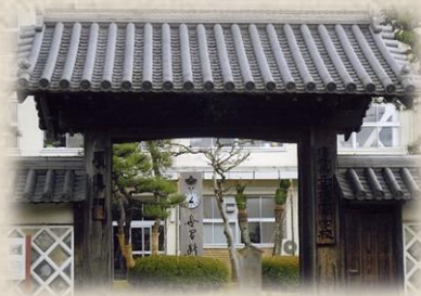
(順造門:小浜藩の藩校だった「順造館」の正門)