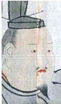
足利義昭画像 (東京大学史料編纂所所蔵複製)