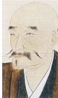
斎藤道三(利政)画像 (東京大学史料編纂所所蔵複製)