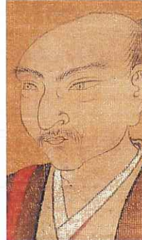
朝倉義景画像 (心月寺蔵)