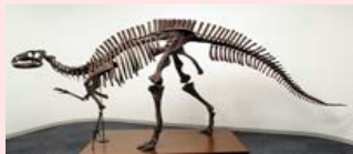
フクイサウルス全身骨格(全長約4.7m)