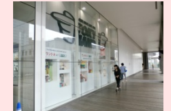
場所:東急ハンズ2階 ショウウィンドウ内