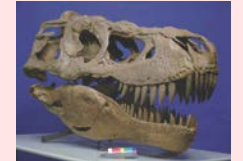
タルボサウルス頭骨(全長約1.4m)