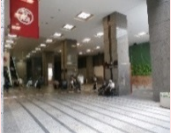
場所:新宿高島屋1階JR口特設会場

○ガチャピン1日店長(3月22日(日)) ○ジュラチック1日店長(4月5日(日)) ○恐竜探検!スタンプラリーの実施