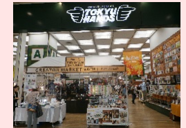
場所:東急ハンズ2階 サザンテラス口店舗内