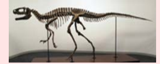
フクイラプトル全身骨格(全長約4.2m)