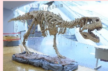
アウカサウルス全身骨格(全長約5.6m) 場所:12階レストランズパーク 特設会場