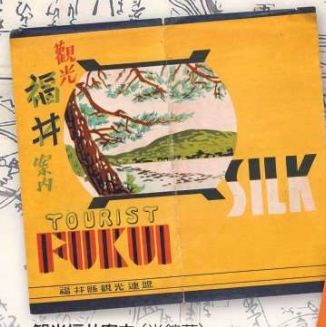
観光福井案内 (当館蔵)

【後援】 福井新聞社、FBC、福井テレビ、FM福井、RCN、 チャンネルO、MMネット