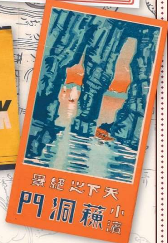
天下の絶景小浜蘇洞門 (当館蔵)