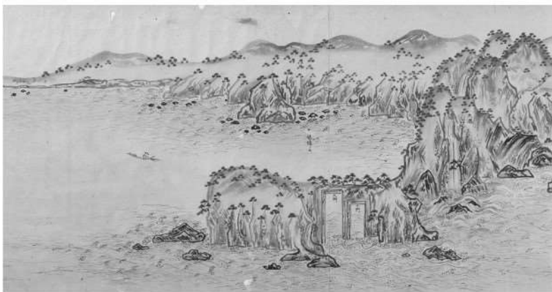
小浜城下蘇洞門景観図絵巻 (当館蔵 県指定)