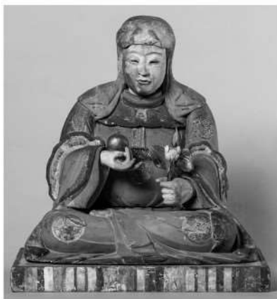
八百比丘尼像 (神明神社蔵)