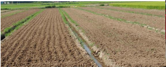
小畦立て播種 平畦播種 図1 小畦立て播種と平畦播種の比較