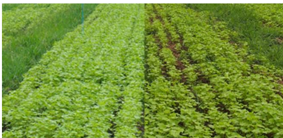
小畦立て 平畦 図3 ソバ小畦立て播種による湿害発生状況の比較