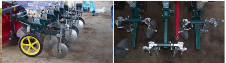
図2 小畦立て播種装置装着図。ベース:RXG-6PSE(アグリテクノ/矢崎) 覆土輪と鎮圧輪を外して、小畦立て装置に換装する。