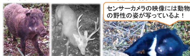
センサーカメラの映像には動物の野性の姿が写っているよ！