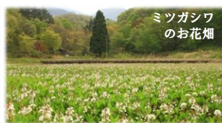
ミツガシワのお花畑