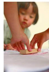
『北斎Tシャツ』 ※イメージ