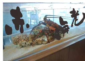
『魚魚初め(ととぞめ)』

名 称：魚魚初め(ととぞめ) 開催期間：2014年12月27日(土)～2015年2月1日(日) 開催場所：館内各所 参加方法：当日受け付け 開催内容：期間中、展示している13種類のいきもの水槽に マエダカマリ氏が書いた漢字を展示します。エント ランスで配布するカードに自分が好きな漢字を書い て投票します。「人鳥(ペンギン)」「水海月(ミズ クラゲ)」など、普段見慣れたいきもの名前も 漢字で表現すると新たな発見があるはずです。