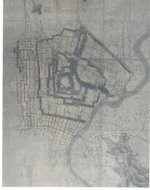
福井御城下之絵図 (複製、部分、当館蔵) 原資料：御城下之絵図 (松平文庫蔵、福井県文書館保管)