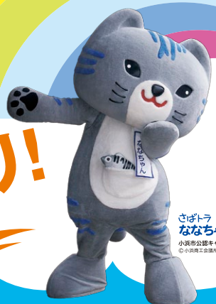
さばトラ ななちゃん 小浜市公認キャラクター