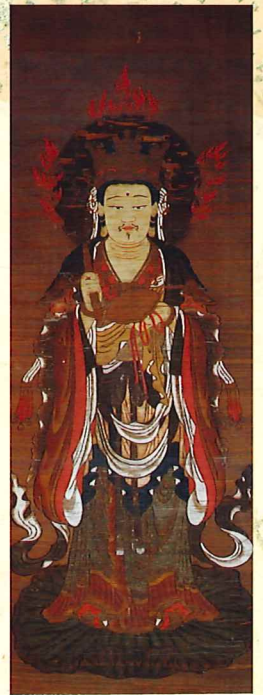
十二天像（帝釈天像） 羽賀寺蔵／室町時代 【福井県指定文化財】