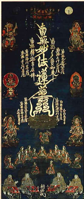
十界勧請大曼荼羅図 本境寺蔵／南北朝時代 【福井県指定文化財】