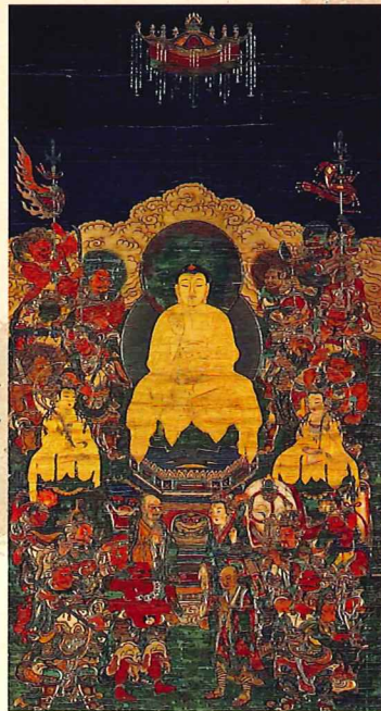
釈迦十六善神像 神宮寺蔵／南北朝時代