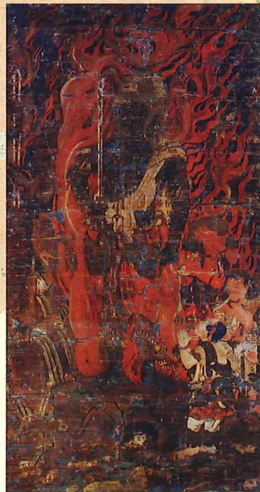
不動明王三童子像 萬徳寺蔵／鎌倉時代 【重要文化財】