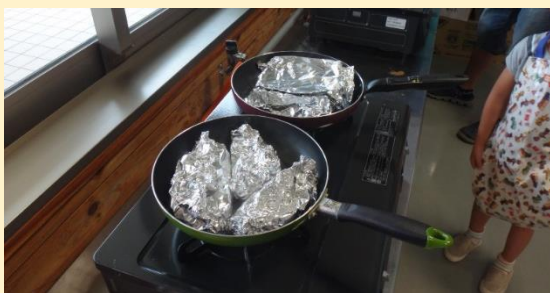
ホイルに包んで焼きます。