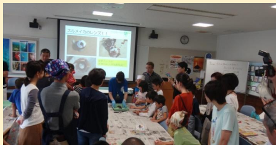
イカの体の仕組みを説明します。