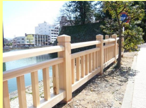
福井城址のお堀にかかる橋の欄干