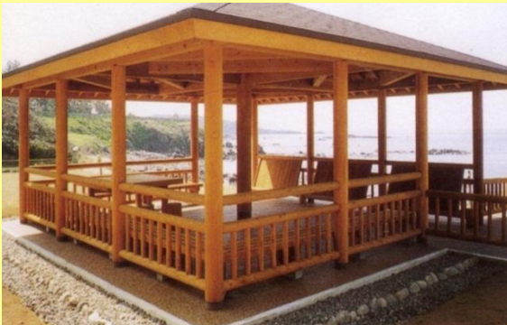
福井県内の公園の東屋