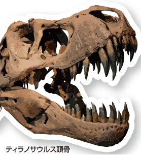
ティラノサウルス頭骨